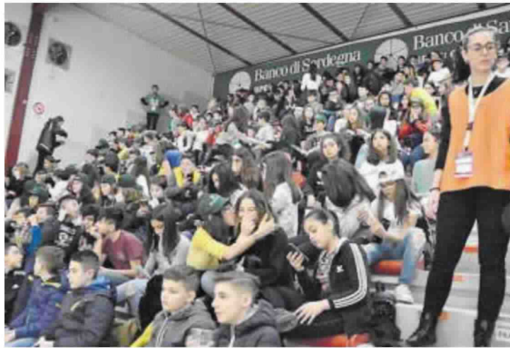
Uno scorcio del settore D con gli scolari e gli addetti della Dinamo